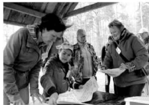
Жюри подсчитывает баллы