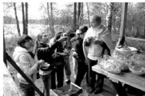
Обед на слёте

мире, на станции «Птичья» отгадывали названия восьми птиц таким образом, чтобы из их начальных букв получилось название девятой