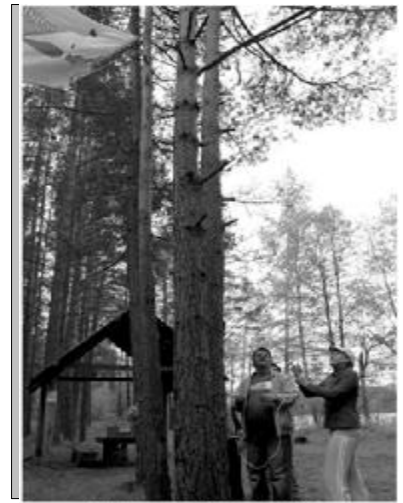
Поднятие флага слёта

мире, на станции «Птичья» отгадывали названия восьми птиц таким образом, чтобы из их начальных букв получилось название девятой